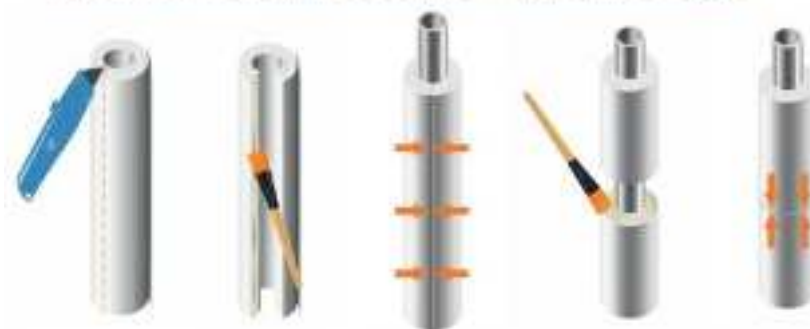
Изоляция смонтированных трубопроводов

Паспорт разработан в соответствии с требованиями ГОСТ 2.601-2019